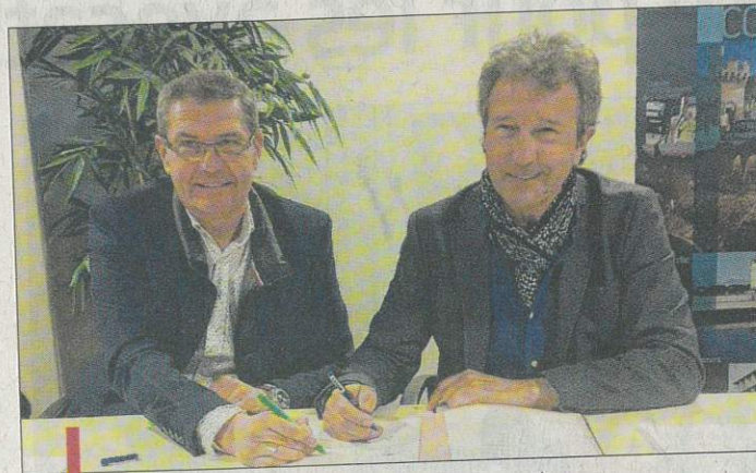
Les deux présidents ont signé une convention.